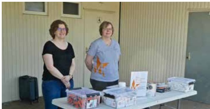
Mitarbeiterinnen der Stiftung boten Typisierungen an.

den Kreis Südsaar der 1. FC Saarbrücken der SVR Völklingen und in Schaffhausen für den Kreis Westsaar die JSG Moseltal und die JSG Bisttal jeweils für den Landesentscheid. Dieser wird am Sonntag, den 29. Mai ab 10.30 Uhr auf der Sportanlage Espenwald der DJK Püttlingen ausgetragen.