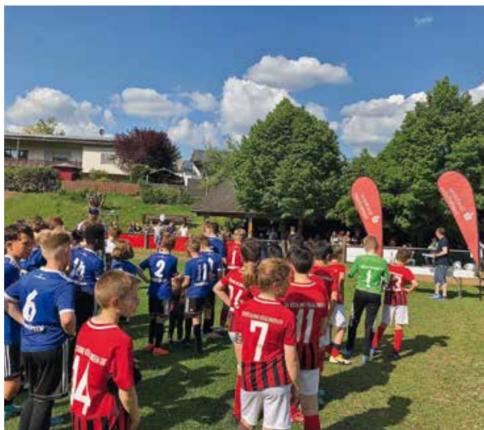
Siegerehrung in Karlsbrunn.

Der Sparkassen-E-Jugendcup gliedert sich wieder in die vier Kreisentscheide und einen Landesentscheid. Die Kreisentscheide fanden am 7. Mai in Selbach, Elversberg, Karlbrunn und Schaffhausen statt. In Selbach qualifizierten sich für den Kreis Nordsaar die SG SF Eiweiler und der VfL Primstal, in Elversberg für den Kreis Ostsaar die SV Elversberg und die DJK St.Ingbert, in Karlbrunn für